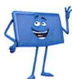
TABLEAU DE COMPOSITION DES MULTIPLEX

Ci-après en jaune les 2 multiplex concernés par les changements de fréquences.