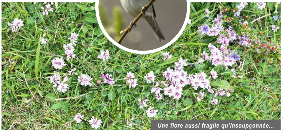
Une flore aussi fragile qu'insoupçonnée...