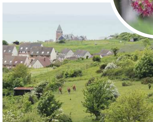
Les coteaux crayeux, un milieu naturel varié et intéressant...