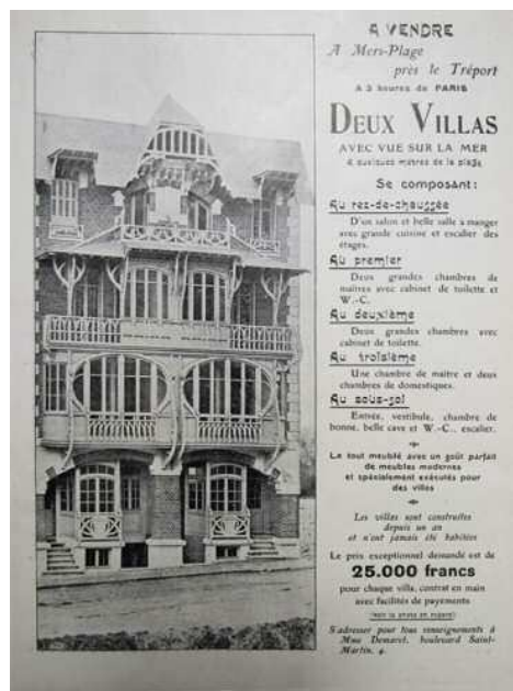
▲ Art et Curiosité, 10 avril 1904, Institut français d'architecture...