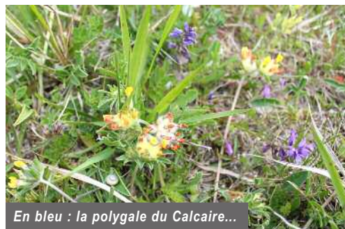
En bleu : la polygale du Calcaire...