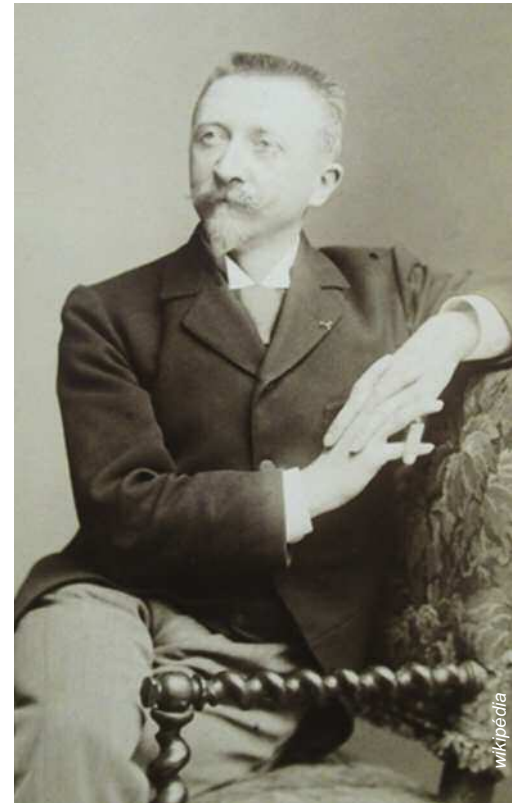
▲ Edouard Niermans par Pierre PETIT, (1895)

L'ouverture de la ligne de chemin de fer Paris-Le Tréport/Mers en 1873 encourage et stimule la construction privée. Plusieurs architectes