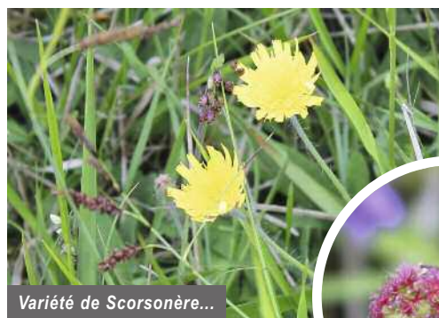
Variété de Scorsonère...