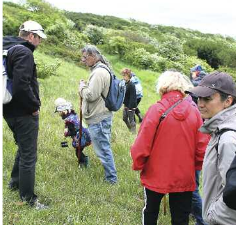
Les sentiers qui parcourent les coteaux Mersois, avec vue sur mer...