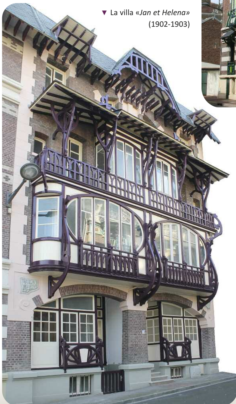
▼ La villa «Jan et Helena» (1902-1903)