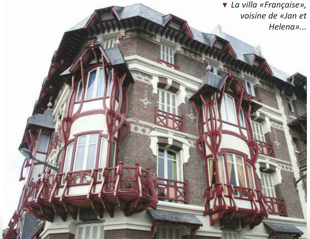
▼ La villa «Française», voisine de «Jan et Helena»...