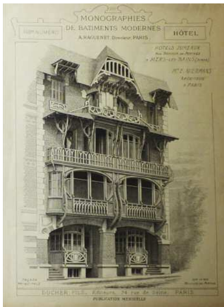
▲ Raguenet A. Monographies de bâtiments modernes. Paris : Ducher, 1904, n° 199.

Edouard NIERMANS a aussi réalisé, entre autres lieux prestigieux, le célèbre Hôtel Negresco sur la promenade des Anglais de Nice, la brasserie Mollard, la taverne Pousset, le Casino de Paris, les Folies Bergère, le Moulin-Rouge à Paris ainsi que des hôtels comme le Palace Hôtel à Ostende en Belgique et la reconstruction de l'hôtel du Palais (villa Eugénie) à Biarritz.