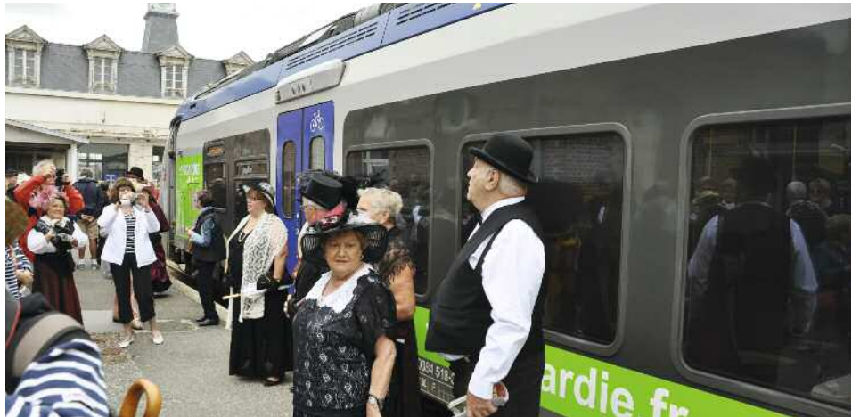
Les lignes SNCF revêtent une importance primordiale pour les communes qu'elles desservent...