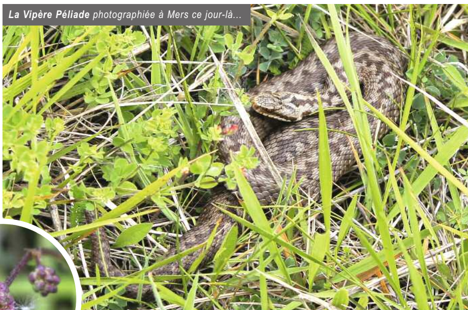
La Vipère Péliade photographiée à Mers ce jour-là...