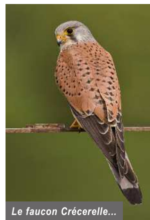
Le faucon Crécerelle...