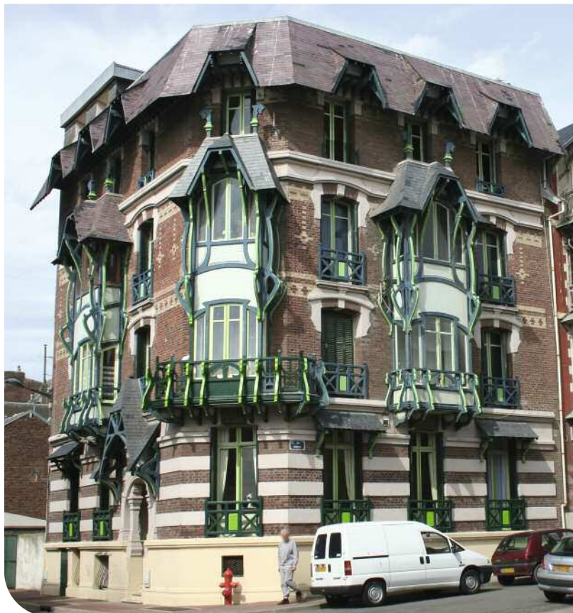
▲ La Villa «Parisienne», avenue Foch...