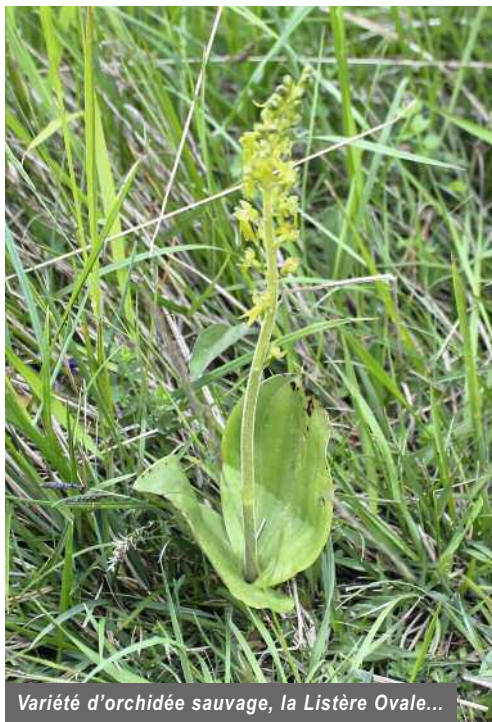
Variété d'orchidée sauvage, la Listère Ovale...