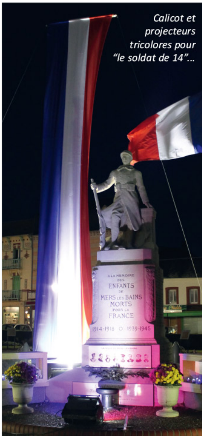
Calicot et projecteurs tricolores pour "le soldat de 14"...