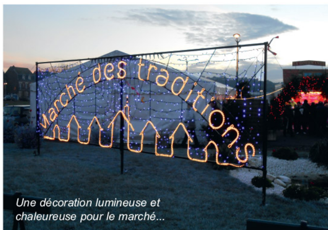
Une décoration lumineuse et chaleureuse pour le marché...