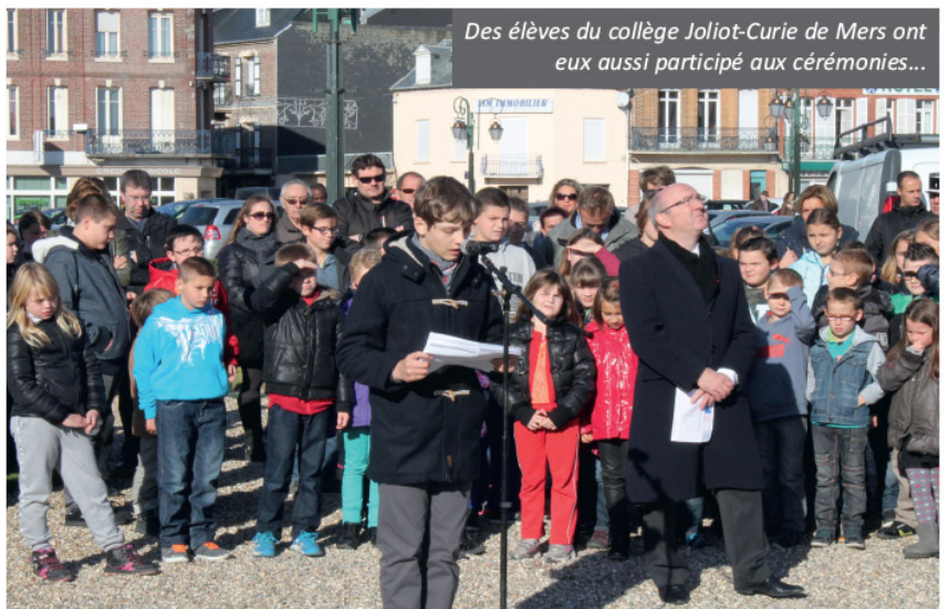
Des élèves du collège Joliot-Curie de Mers ont eux aussi participé aux cérémonies...