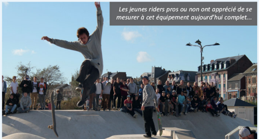
Les jeunes riders pros ou non ont apprécié de se mesurer à cet équipement aujourd'hui complet...

La mairie a assuré l'aide technique et logistique de cette session inaugurale "de ce qui est aujourd'hui un des plus beaux street-park du nord de la France. On a même des jeunes qui viennent du Touquet pour pratiquer !" s'est réjoui Mr le maire Emmanuel Maquet.