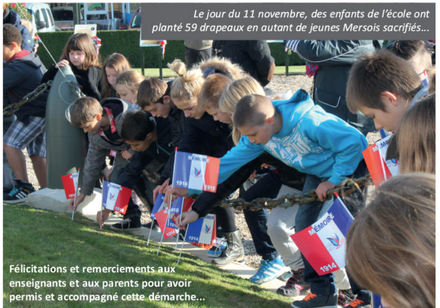
Le jour du 11 novembre, des enfants de l'école ont planté 59 drapeaux en autant de jeunes Mersoises sacrifiées...