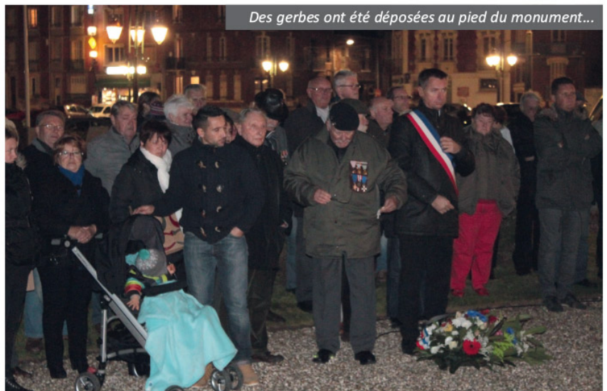
Des gerbes ont été déposées au pied du monument...