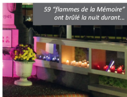
59 "flammes de la Mémoire" ont brûlé la nuit durant...