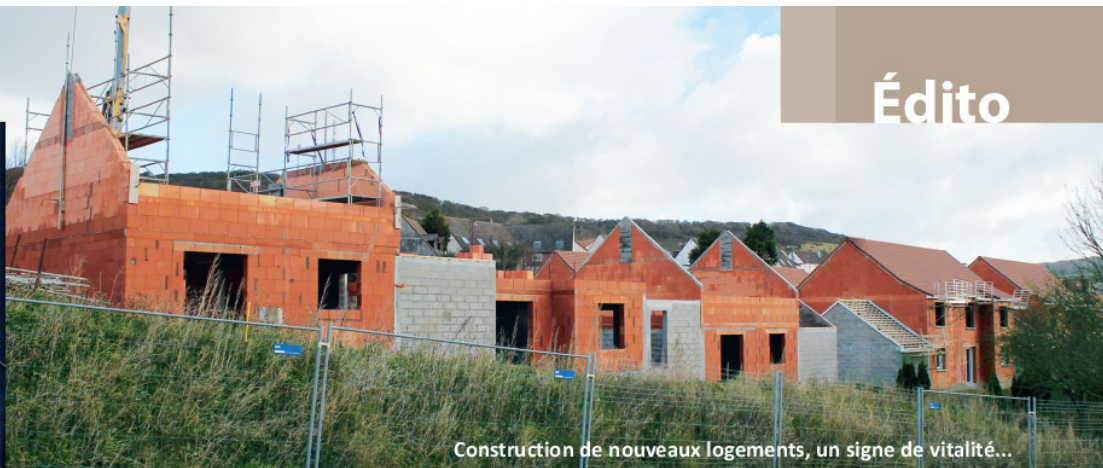
Construction de nouveaux logements, un signe de vitalité...