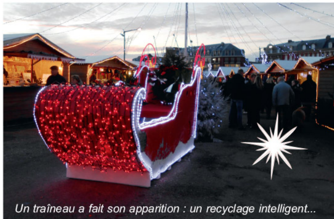
Un traîneau a fait son apparition : un recyclage intelligent...