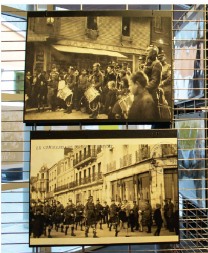
Des Soldats Ecossais jouaient de la Cornemuse dans les rues Mersaises...