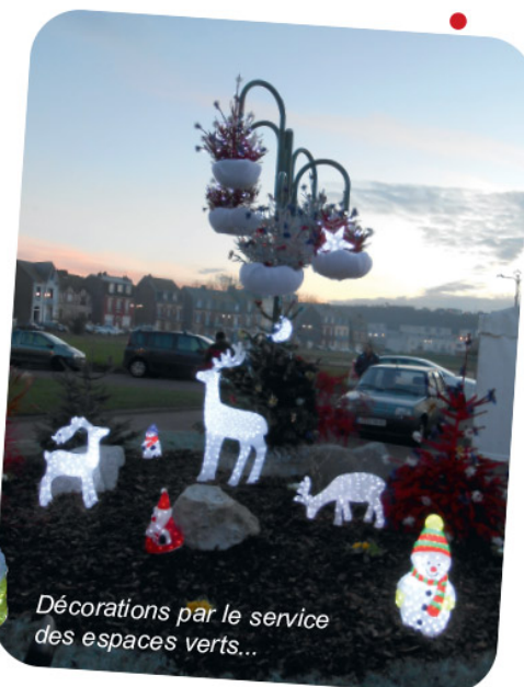
Décorations par le service des espaces verts...