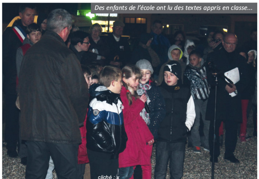
Des enfants de l'école ont lu des textes appris en classe...