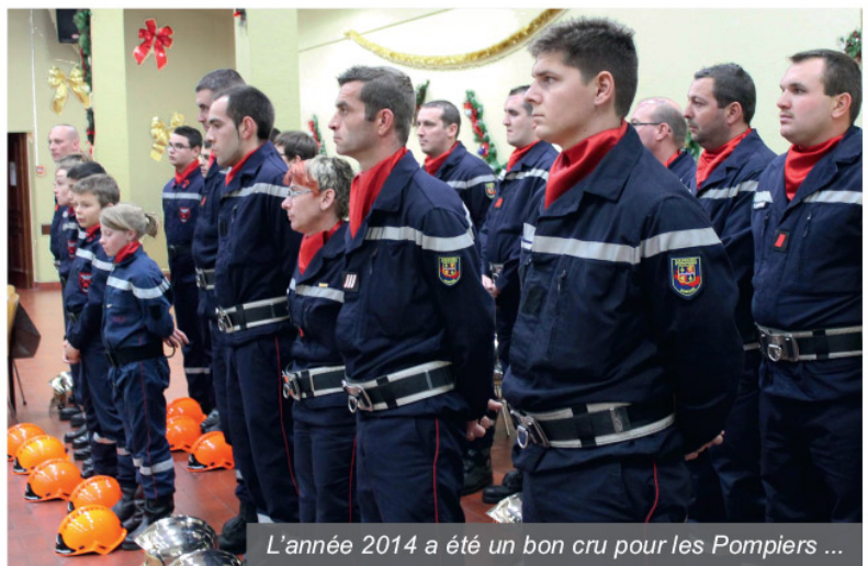
L'année 2014 a été un bon cru pour les Pompiers ...

Mr le maire appelait à une prise de conscience précise, "Il y a nécessité, pour la population, pour les Mersois, de bien intégrer, de prendre en compte la notion de risque réel, quel qu'il soit (montées avérées du niveau de la mer par réchauffement climatique, inondations, tempêtes, etc...), à plus ou moins long terme, ceci afin de s'en prémunir au mieux".