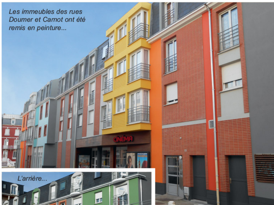
Les immeubles des rues Doumer et Carnot ont été remis en peinture...