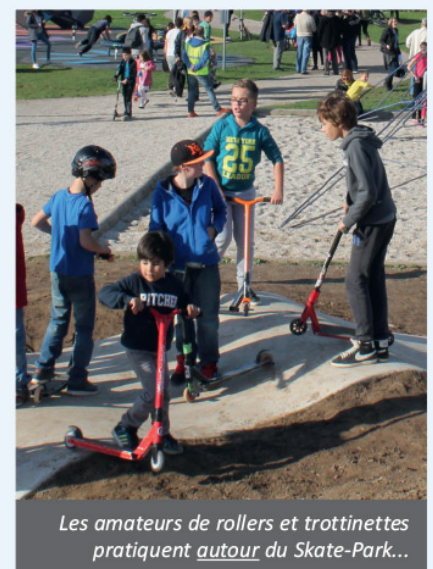
Les amateurs de rollers et trottinettes pratiquent autour du Skate-Park...