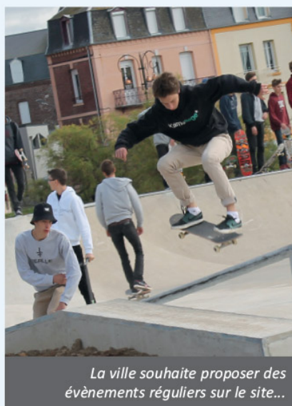
La ville souhaite proposer des évènements réguliers sur le site...