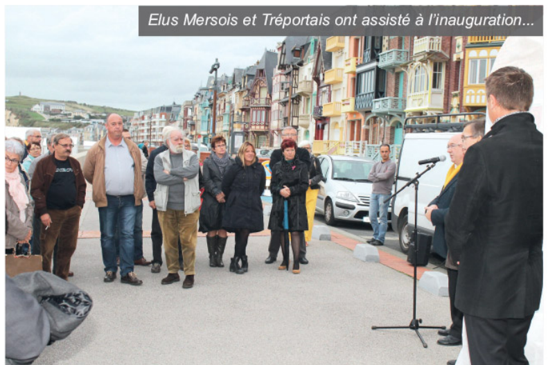
Elus Mersoises et Tréportais ont assisté à l'inauguration...

Revêtue d'une décoration précise, avec les blasons des différentes communes et entités concernées en céramiques et pâtes de verre par la céramiste Louise Bulcourt, la borne présente aussi deux couleurs, le rouge pour la route nationale et le Jaune pour la départementale, en un clin d'oeil au passé, mais pas seulement. "Elle se veut être bien plus un trait d'union qu'une simple délimitation