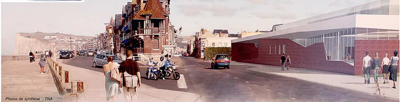
▼ Nouvelle porte d'entrée sur Mers-les-Bains, le futur Centre aquatique prévu pour 2015...