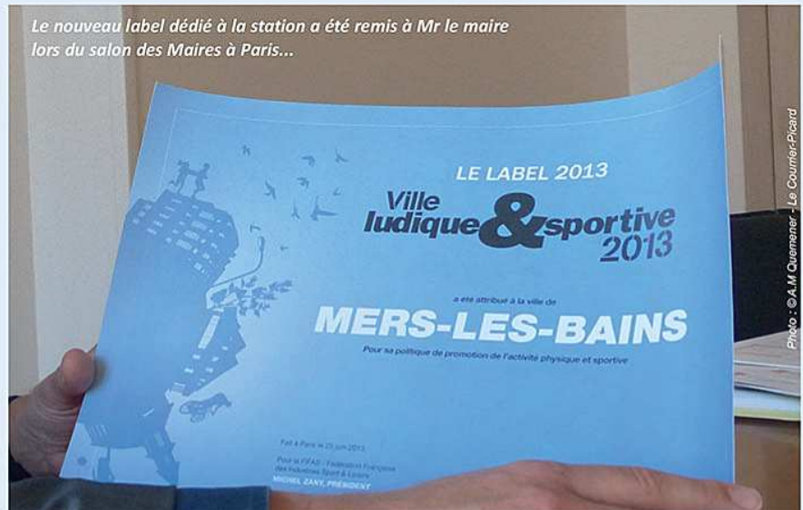
Le nouveau label dédié à la station a été remis à Mr le maire lors du salon des Maires à Paris...

Parmi les villes labellisées comme Mers-les-Bains, on trouve Ajaccio, Annecy, Baume-les-Dames, Cour-