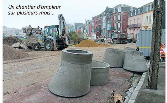
Un chantier d'ampleur sur plusieurs mois...