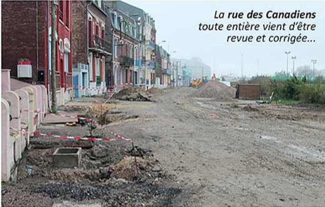
La rue des Canadiens toute entière vient d'être revue et corrigée...