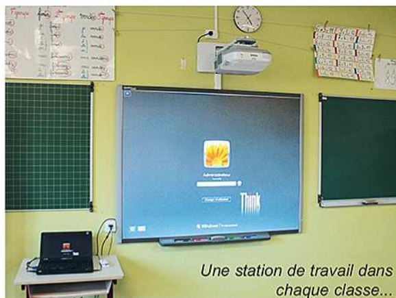
Une station de travail dans chaque classe...

Chaque tableau installé est piloté par un ordinateur portable. L'enseignant peut agir directement sur l'écran soit avec ses mains, soit par le biais de stylos spéciaux de couleur et