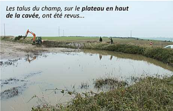
Les talus du champ, sur le plateau en haut de la cavée, ont été revus...