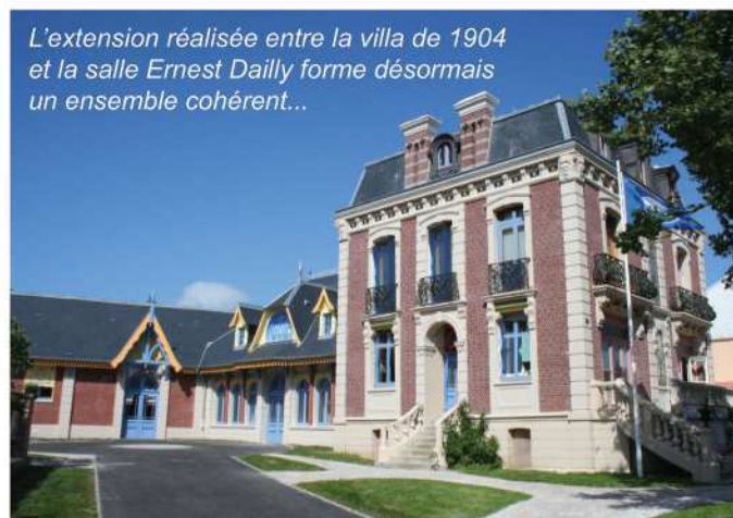
L'extension réalisée entre la villa de 1904 et la salle Ernest Dailly forme désormais un ensemble cohérent...

L'extension de l'hôtel de ville permettra d'accroître la surface des services, à l'étroit compte tenu de l'évolution des besoins et des missions qui leur sont confiées, par le biais d'un trait d'union cohérent entre la villa "Henri", (ancienne maison de maître devenue la mairie en novembre 1904 après son achat aux enchères par le maire Charles Le Beuf), et la salle Ernest Dailly, salle officielle des mariages et du Conseil Municipal. Il fallait favoriser une interface moderne et intuitive, permettant aussi de circuler d'un édifice à l'autre sans passer par l'extérieur.