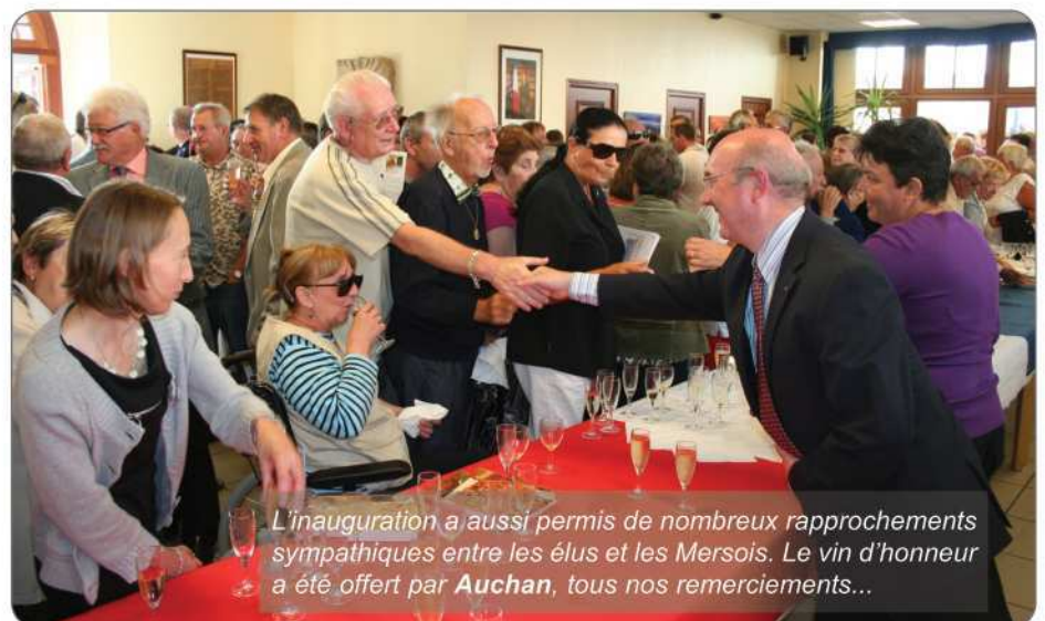
L'inauguration a aussi permis de nombreux rapprochements sympathiques entre les élus et les Mersois. Le vin d'honneur a été offert par Auchan, tous nos remerciements...