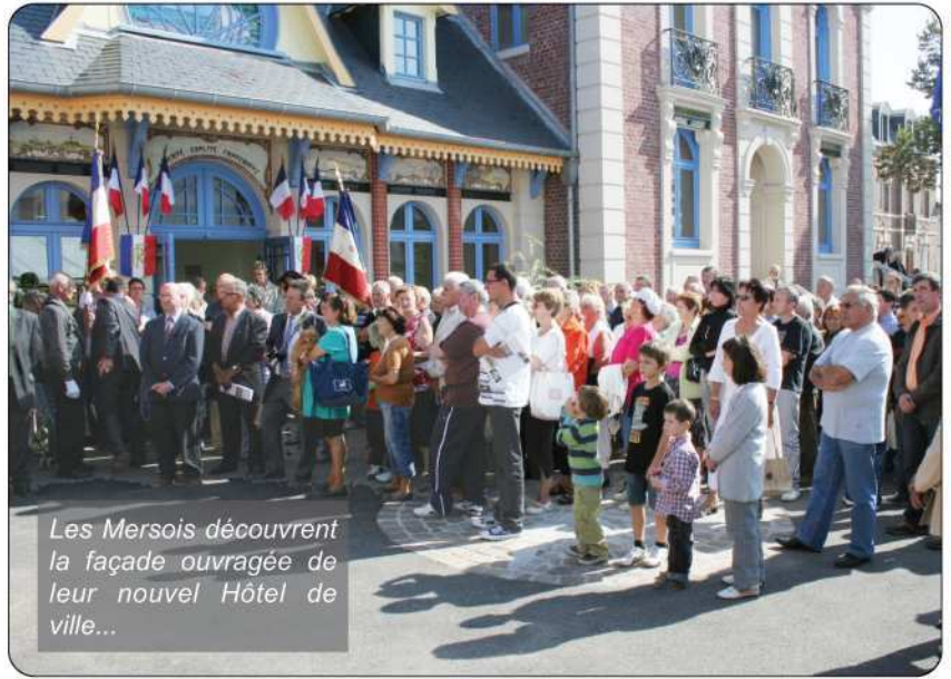
Les Mersois découvrent la façade ouvragée de leur nouvel Hôtel de ville...