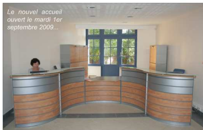
Le nouvel accueil ouvert le mardi 1er septembre 2009...

Là encore, nous avons voulu que l'harmonisation des abords puisse apporter à l'espace public une complète sérénité. (En opposition totale avec les fatigants «happening» archimédiatiques contemporains, qui usent les sens, avilissent les sensibilités et se démodent immédiatement.) Pour résumer, la réhabilitation/extension de la Mairie exprime l'ambiance des architectures pittoresques du front de mer tout en reprenant des modénatures et certains détails du bâtiment plus classique de l'actuelle Mairie.