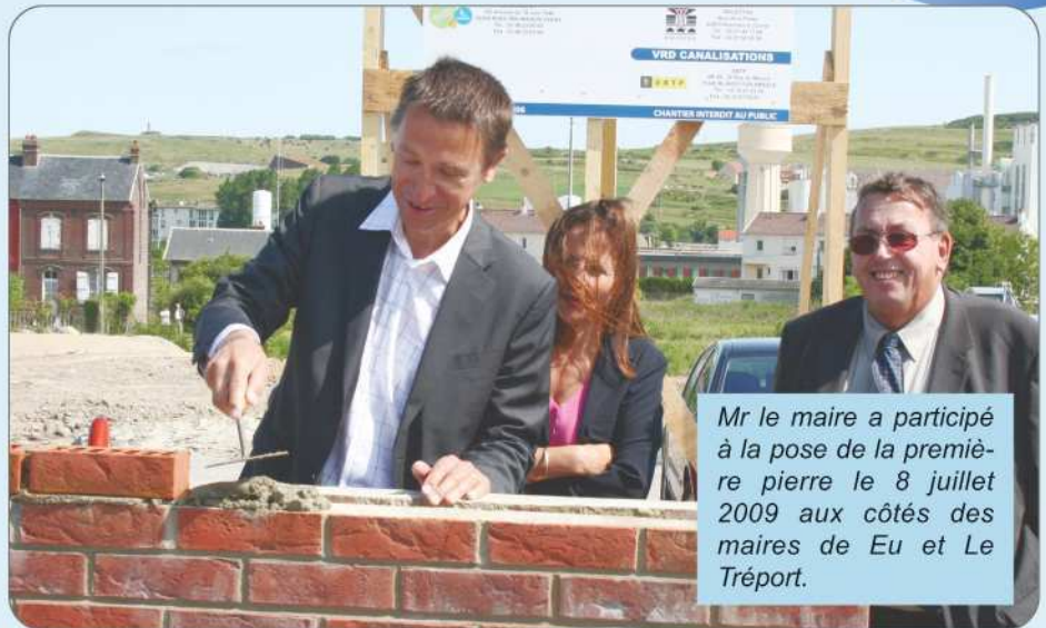
Mr le maire a participé à la pose de la première pierre le 8 juillet 2009 aux côtés des maires de Eu et Le Tréport.