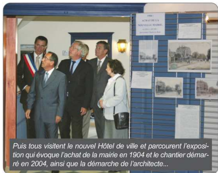
Puis tous visitent le nouvel Hôtel de ville et parcourent l'exposition qui évoque l'achat de la mairie en 1904 et le chantier démarré en 2004, ainsi que la démarche de l'architecte...