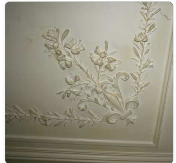
La rosace est entourée d'une corniche et d'une guirlande de fleurs. Le plafond présente aussi de superbes cabochons. Pourront-ils être restaurés ?