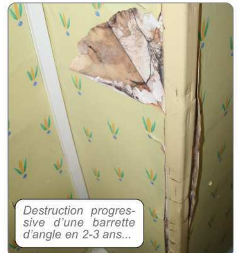
Destruction progressive d'une barrette d'angle en 2-3 ans...