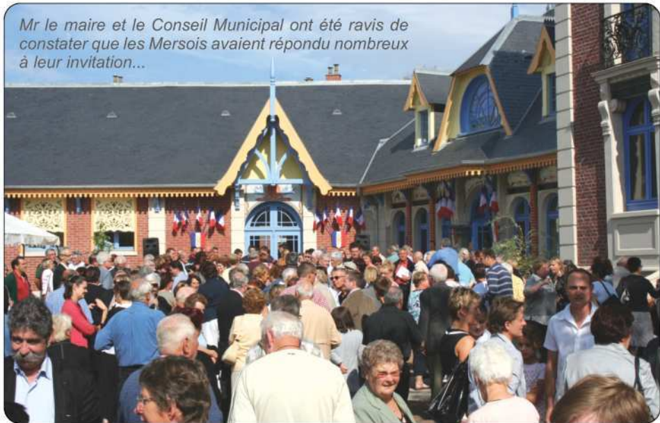
Mr le maire et le Conseil Municipal ont été ravis de constater que les Mersoises avaient répondu nombreux à leur invitation...