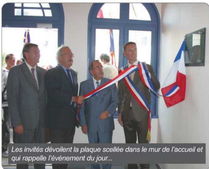
Les invités dévoilent la plaque scellée dans le mur de l'accueil et qui rappelle l'évènement du jour...