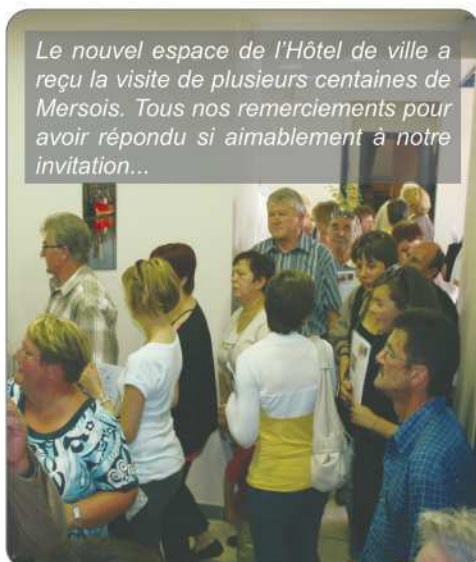
Le nouvel espace de l'Hôtel de ville a reçu la visite de plusieurs centaines de Mersois. Tous nos remerciements pour avoir répondu si aimablement à notre invitation...