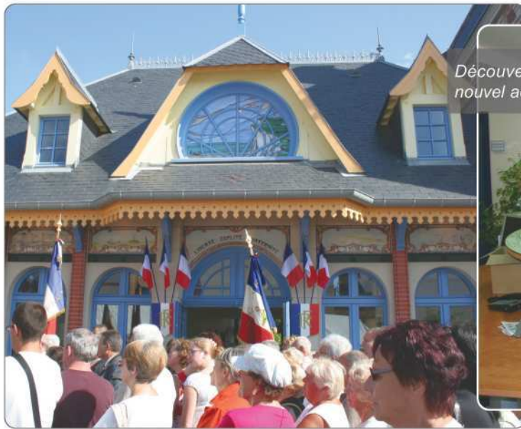
Découverte du nouvel accueil...