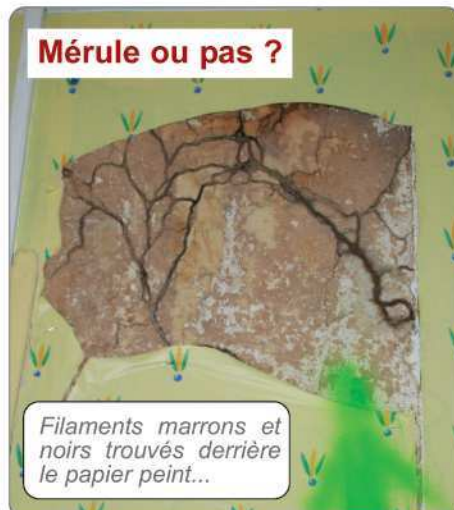
Mérule ou pas ?