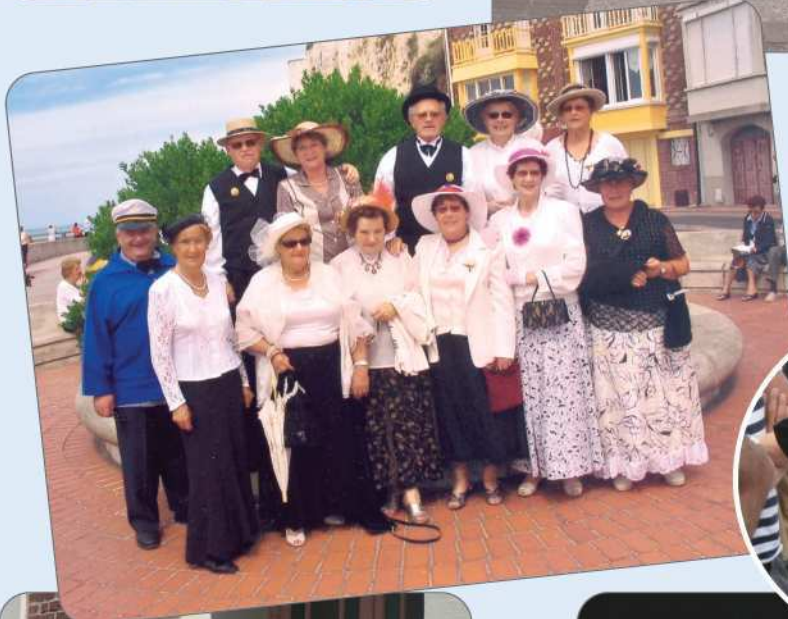
Les aînés Mersoïses sont toujours nombreux à participer à la fête des Baigneurs, merci à eux !