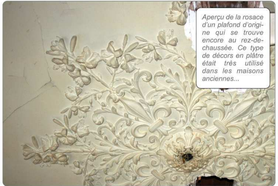
Aperçu de la rosace d'un plafond d'origine qui se trouve encore au rez-de-chaussée. Ce type de décors en plâtre était très utilisé dans les maisons anciennes...

Des repérages de zones infectées ont été effectués (voir ci-contre) et un expert sera consulté afin de se prononcer sur la nature du champignon, sa dangerosité et le moyen de l'éradiquer des murs et des planchers... ■