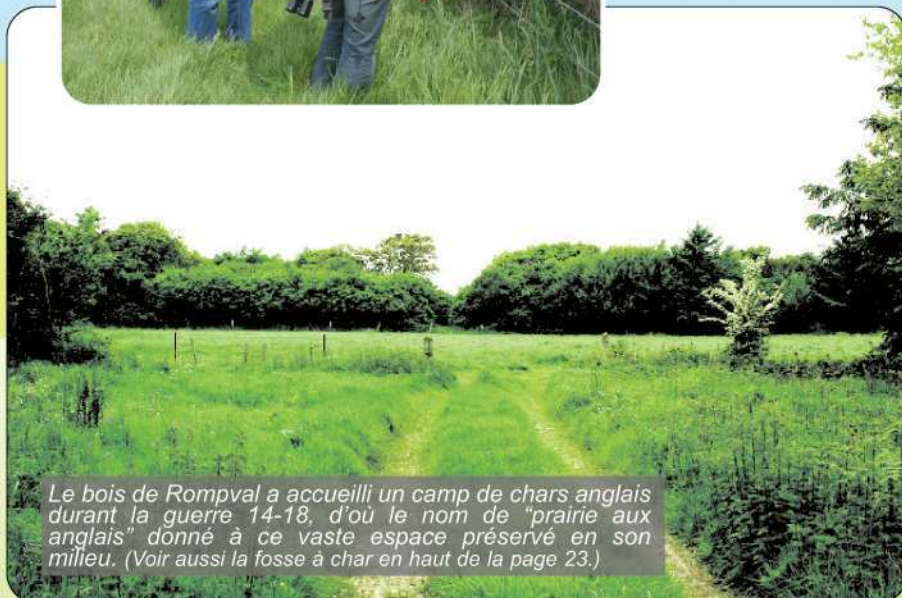
Le bois de Rompval a accueilli un camp de chars anglais durant la guerre 14-18, d'où le nom de "prairie aux anglais" donné à ce vaste espace préservé en son milieu. (Voir aussi la fosse à char en haut de la page 23.)