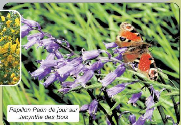
Papillon Paon de jour sur Jacynthe des Bois