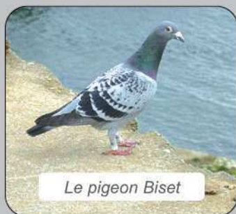
Le pigeon Biset