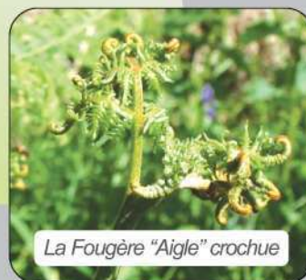
La Fougère "Aigle" crochue