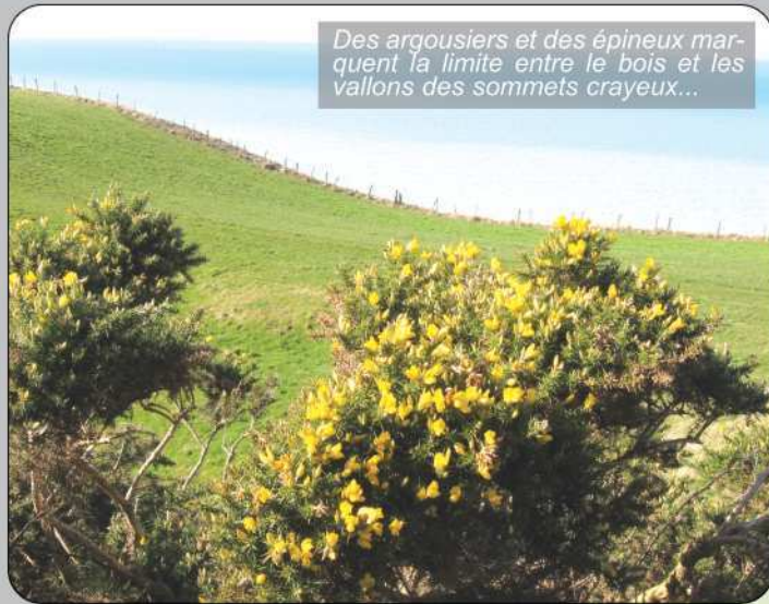
Des argousiers et des épineux marquent la limite entre le bois et les vallons des sommets crayeux...