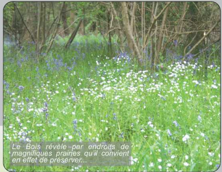
Le Bois révèle par endroits de magnifiques prairies qu'il convient en effet de préserver...