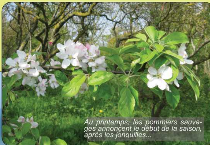
Au printemps, les pommiers sauvages annoncent le début de la saison, après les jonquilles...