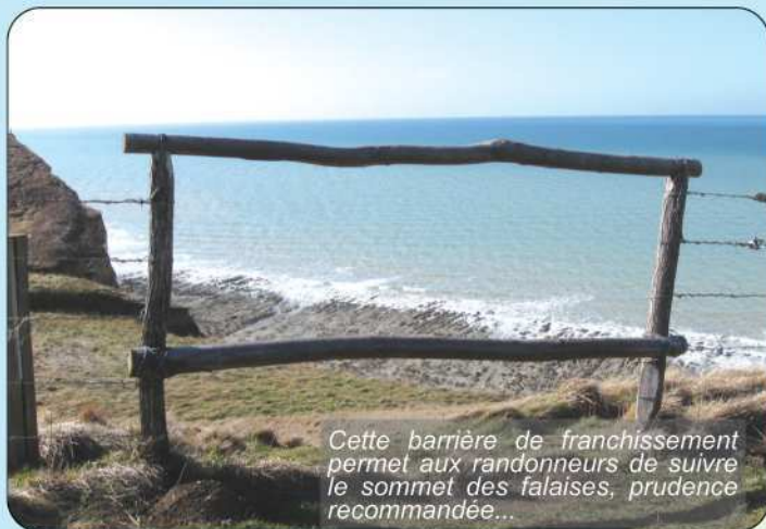
Cette barrière de franchissement permet aux randonneurs de suivre le sommet des falaises, prudence recommandée...