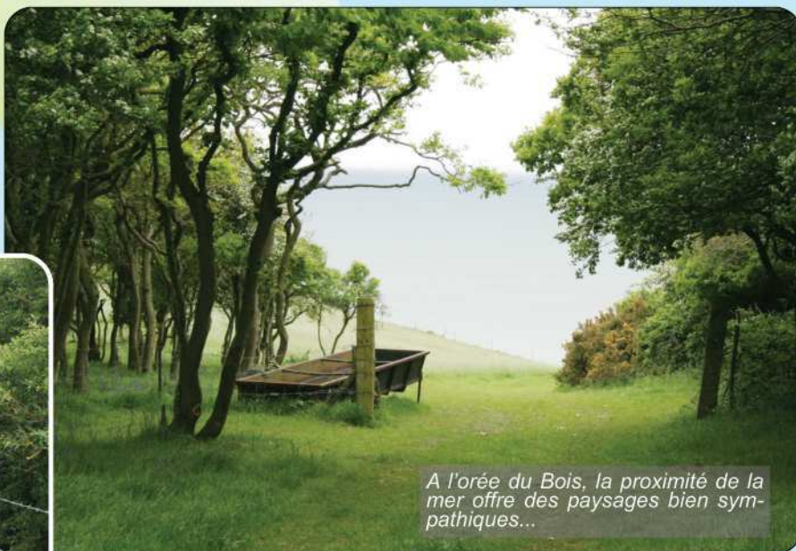
A l'orée du Bois, la proximité de la mer offre des paysages bien sympathiques...