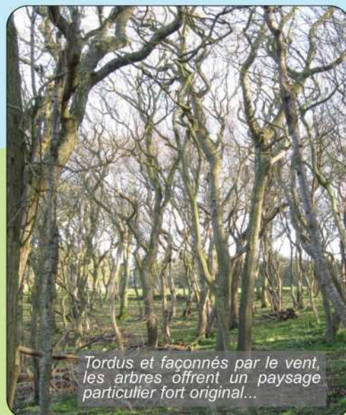
Tordus et façonnés par le vent, les arbres offrent un paysage particulier fort original...