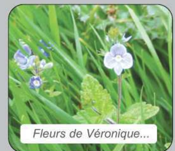
Fleurs de Véronique...