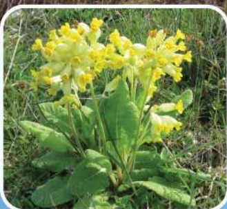
Le "coucou" parsème au printemps les coteaux crayeux de fleurs jaunes ...