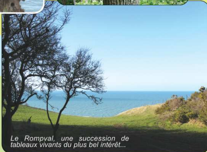
Le Rompvall, une succession de tableaux vivants du plus bel intérêt...

Rappel : si circuler le long des sommets est possible, bien sûr avec précaution, pénétrer dans le bois est interdit . Merci de votre compréhension.