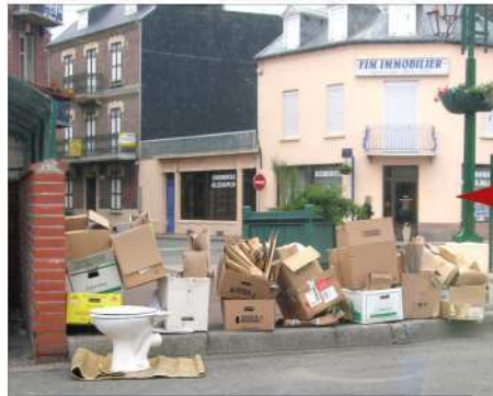
Cartons et déchets : à la déchetterie !

C'est pourquoi, la Communauté de Communes Bresle Maritime a pris la décision de ne plus ramasser les cartons dans le cadre de la collecte des ordures ménagères .