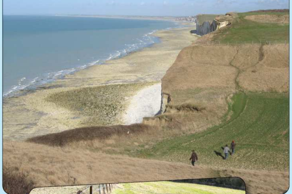
Franchissement de la valleuse de Boulval en venant du panorama de Notre-Dame de la Falaise. On aperçoit le Bois de Rompval au second plan ainsi que Ault...