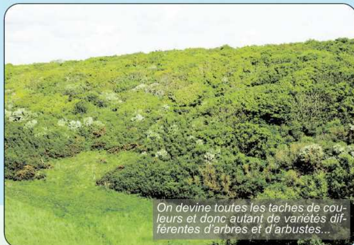
On devine toutes les taches de couleurs et donc autant de variétés différentes d'arbres et d'arbustes...