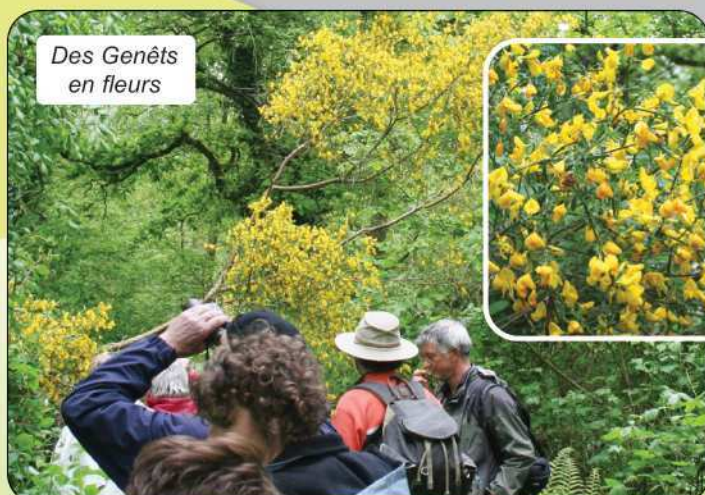
Des Genêts en fleurs

tremble ( Populus tremula ), l'érable champêtre ( Acer campestre ), le frêne ( Fraxinus excelsior ), et le saule marsault ( Salix caprea ). Sur la partie Sud-Est, le chêne pédonculé ( Quercus robur ) reprend sa position dominante. La grande originalité du bois de Rompval réside dans son facteur limitant : le vent. La majorité du peuplement est ainsi anémomorphosée (modification de la forme des plantes et des paysages végétaux sous l'effet des vents dominants) et sa faible croissance laisse place à une entité atypique formée par la "futaie naine". Outre la Bécasse des bois qui reste une familière du site, on observe aussi des espèces nichant sur les falaises comme le Pétrel fulmar (protégé au niveau national), le Pigeon biset et le Goéland argenté.