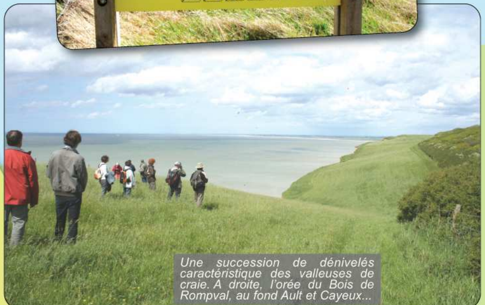
Une succession de dénivelés caractéristique des valleuses de craie. A droite, l'orée du Bois de Rompval, au fond Ault et Cayeux...